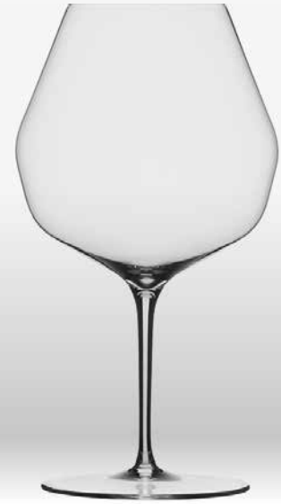
Double Bend Red (Pinot Noir)