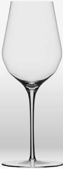
Double Bend White

Glassene er de letteste på markedet op til 20-25% lettere end Zalto og de ligger fantastisk i hånden. Glassene er tynde, stærke, fleksible og de tåler maskinopvask. Kom ned og kig på dem og mærk dem - de er fede!!!