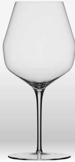
Double Bend Red Expression